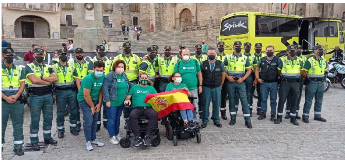
Enfermos de Ela de Trujillo con la Guardia Civil de Tráfico en la Vuelta de Extremadura 2021 en su llegada a la localidad.

Esta prueba ciclista transcurrió por la carretera de La Cumbre, avenida del Perú, y Ramón y Cajal. A partir de ahí, el pelotón se dirigirá por la calle de El Pavo, para enfrentarse a la Cuesta de San Andrés dirección Cambronerías, plaza de Santiago para llegar al castillo, donde está situada la línea de meta.