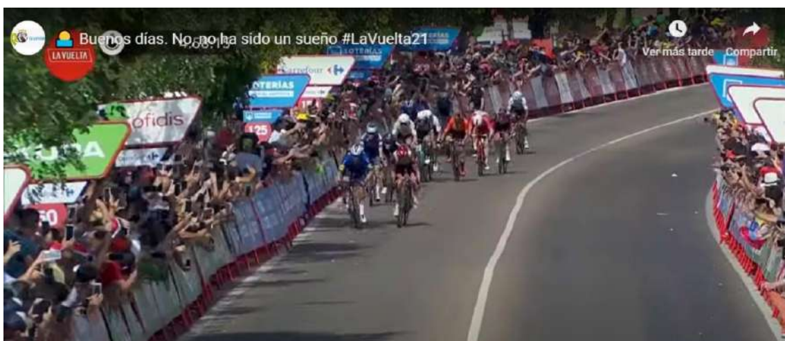
Entrada en Villanueva de la Serena. 13 etapa de la Vuelta 2021