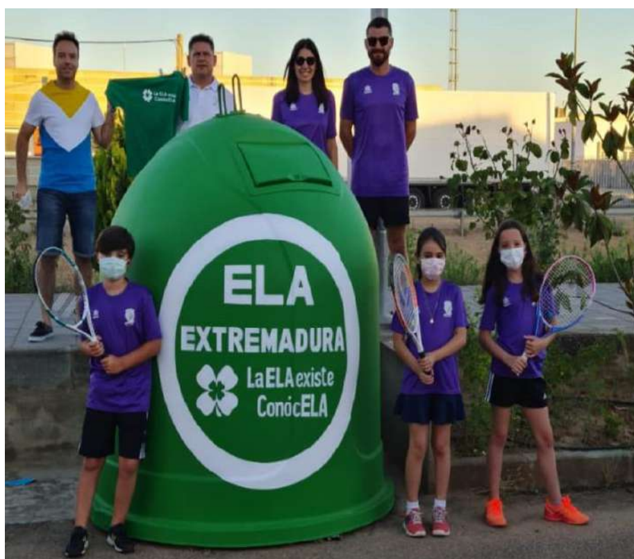
Campaña Talavera limpia y bonita.