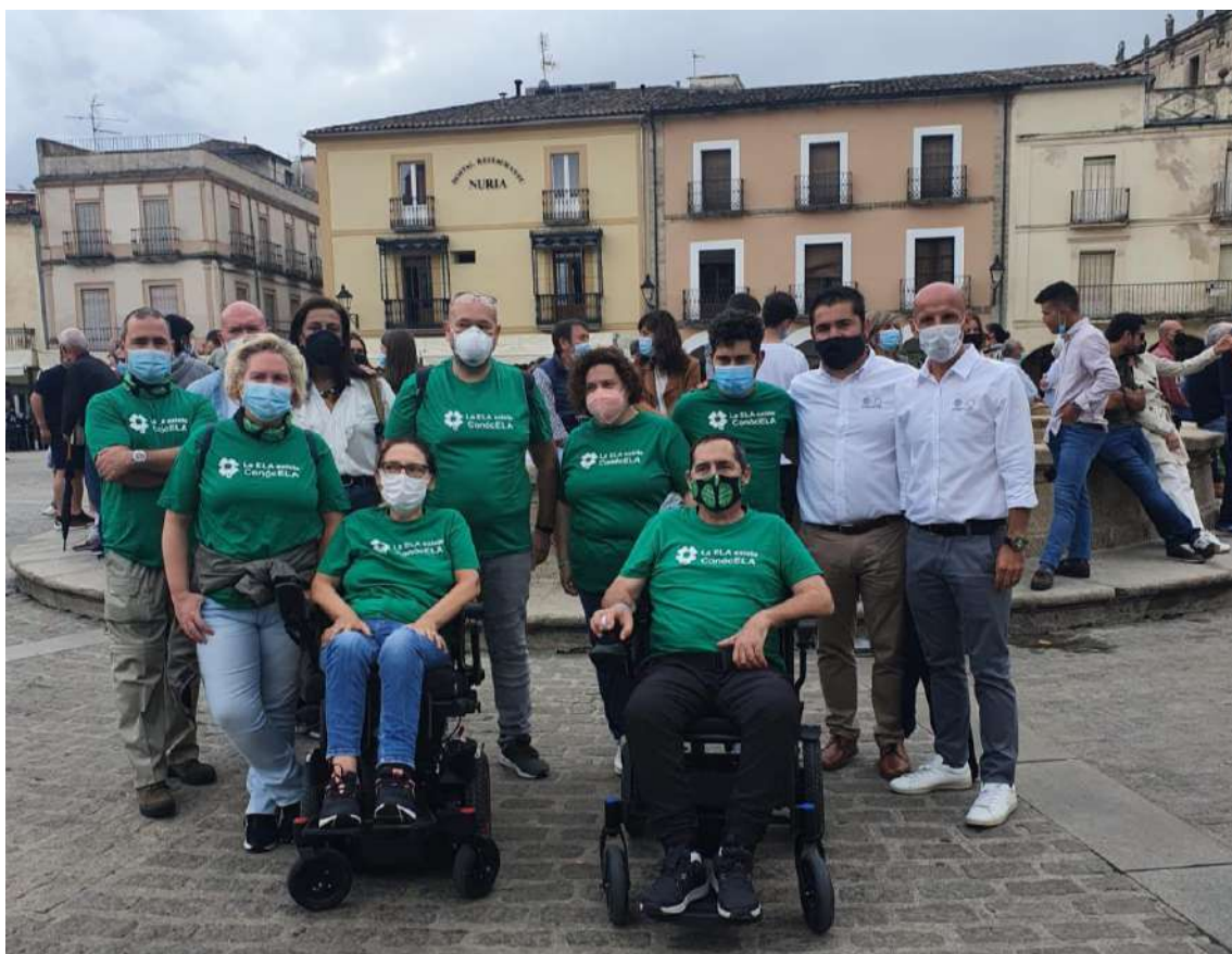
Seguimos en Trujillo dando visibilidad en la segunda etapa ciclista de Extremadura 2021.