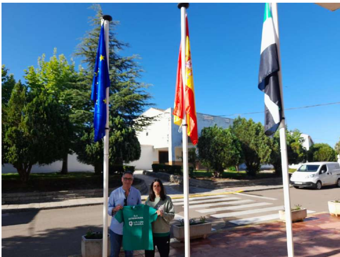
Ayuntamiento de Guadajira

Igualmente, el 11 de octubre en colaboración con el Ayuntamiento de Guadajira se organiza una nueva caminata solidaria con 360 participantes que volvieron a lucir nuestra camiseta.