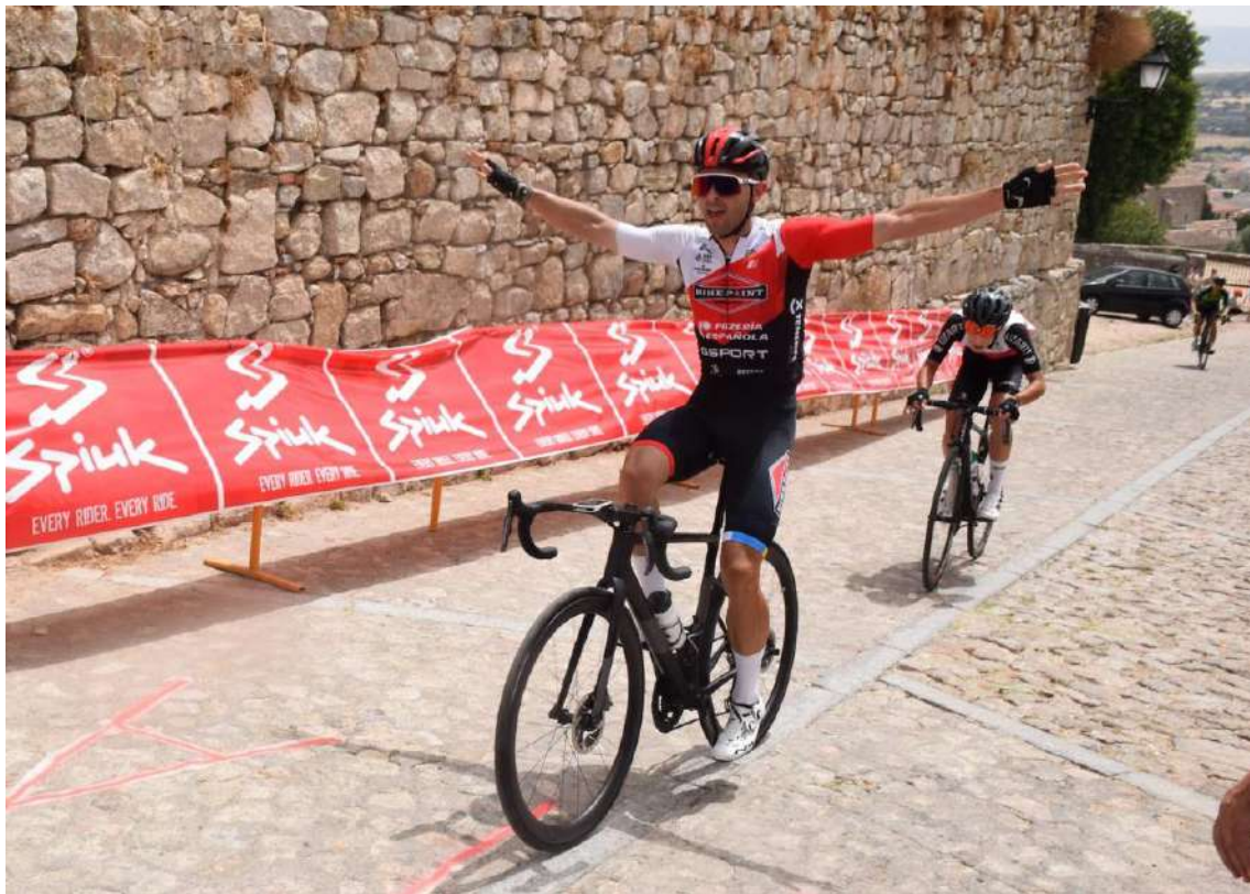
Llegada de ciclistas a meta en la tradicional subida al castillo en Trujillo

Esta prueba ciclista transcurrió por la carretera de La Cumbre, avenida del Perú, y Ramón y Cajal. A partir de ahí, el pelotón se dirigirá por la calle de El Pavo, para enfrentarse a la Cuesta de San Andrés dirección Cambronerías, plaza de Santiago para llegar al castillo, donde está situada la línea de meta.