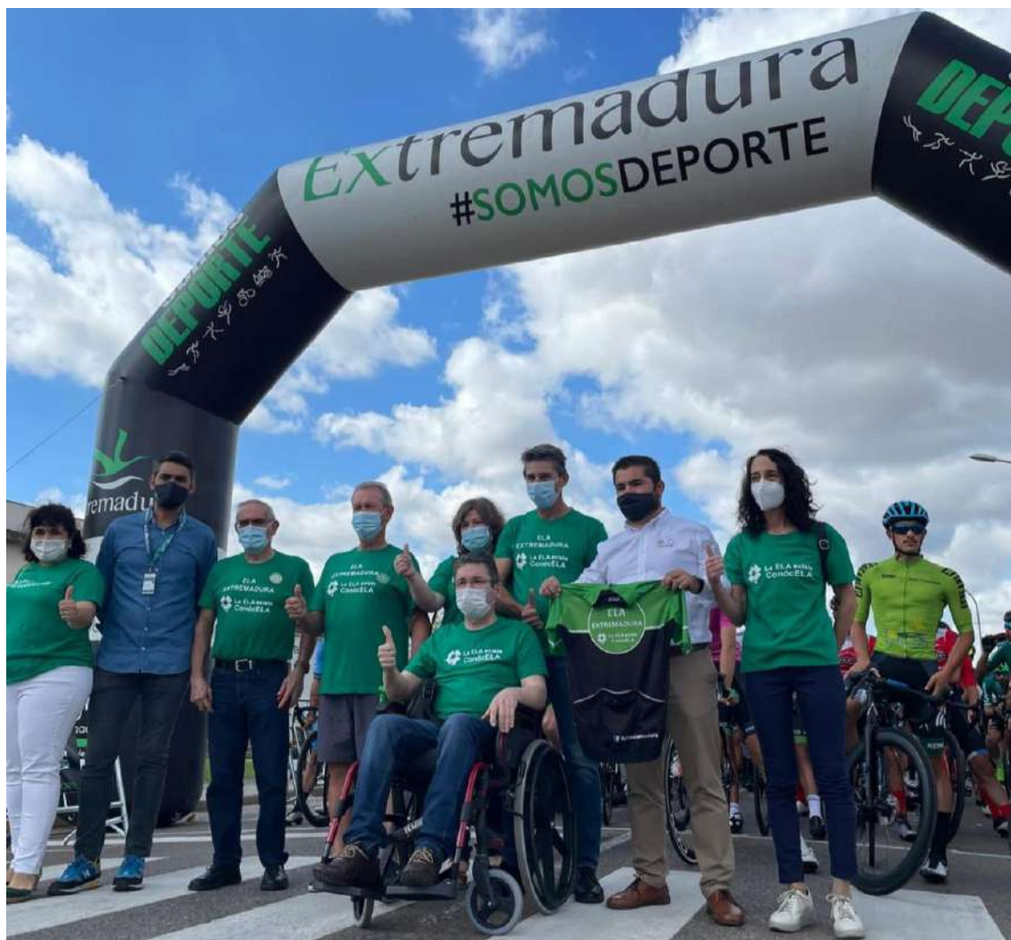
2ª ETAPA DE LA VUELTA CICLISTA A EXTREMADURA SALIDA EN MONTIJO

La primera etapa transcurrió el 24 de septiembre entre Olivenza y Monesterio, La segunda entre Montijo y Trujillo y la tercera entre el Parque Nacional de Monfrague y Hervás. Ela Extremadura Asociación estuvo presente el 25 de septiembre de 2021 en la segunda etapa de la vuelta a Extremadura, en la salida en Montijo y en la llegada a Trujillo con enfermos de Ela, familiares y asociados en ambas localidades para dar visibilidad a la enfermedad.