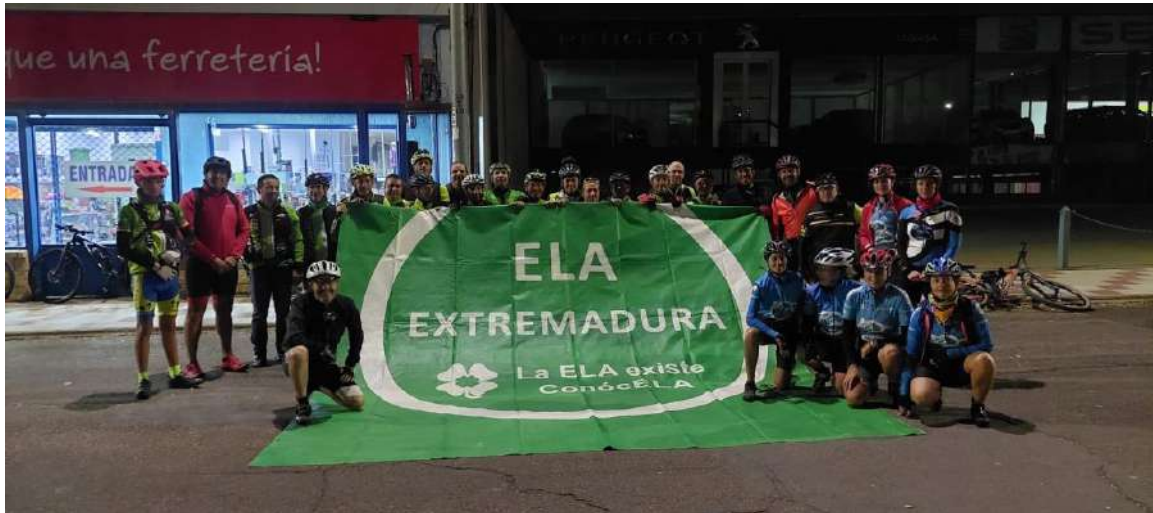
Salida en D. Benito 06 horas día 30 de octubre de 2022