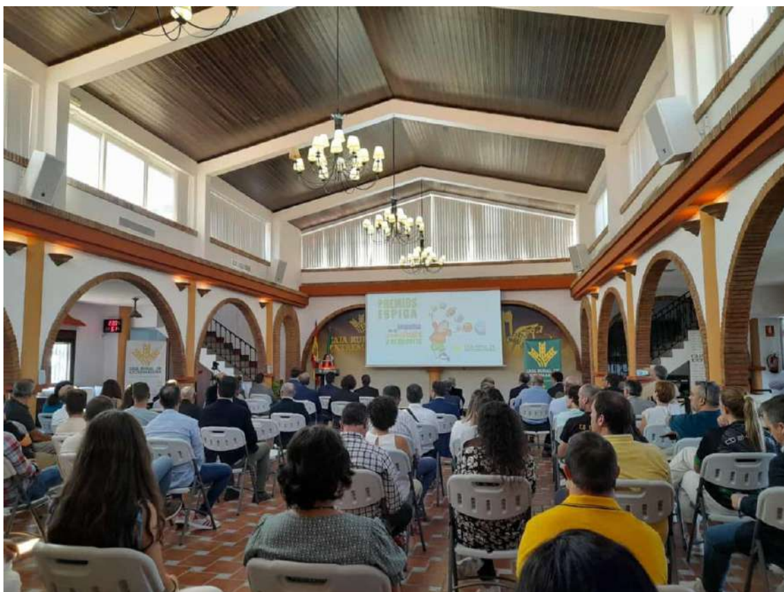
Finca El Toril, Mérida. Premios Espiga

23 de septiembre de 2022. Orellana la Vieja. XI SONER EURO CUP.