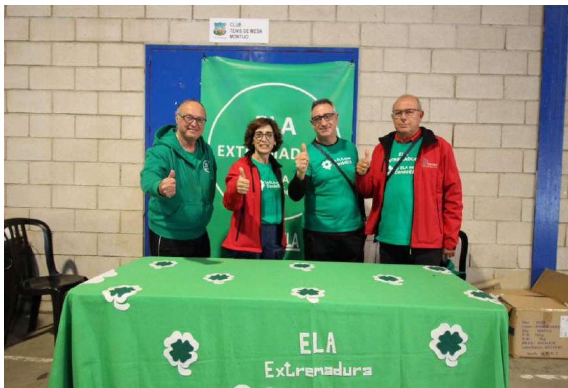
Participantes en la XII Ruta Oficial “Los Arenales” y voluntarios de Ela Extremadura