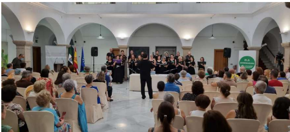
Instantánea del concierto del Coro Juan de la Encina

En el patio noble de la Asamblea de Extremadura se celebró un concierto del Coro Juan de la Encina a favor de la Ela.