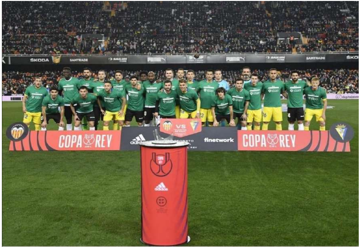
2 de febrero de 2022 Valencia – Cádiz

Un ejemplo de esta actividad fue el partido de fútbol celebrado el 2 de febrero de este año en Mestalla, correspondiente a los cuartos de final de la Copa del Rey entre el Valencia y el Cádiz, donde los jugadores saltaron al campo, fotografiándose, dando visibilidad a la ELA antes del inicio del partido.