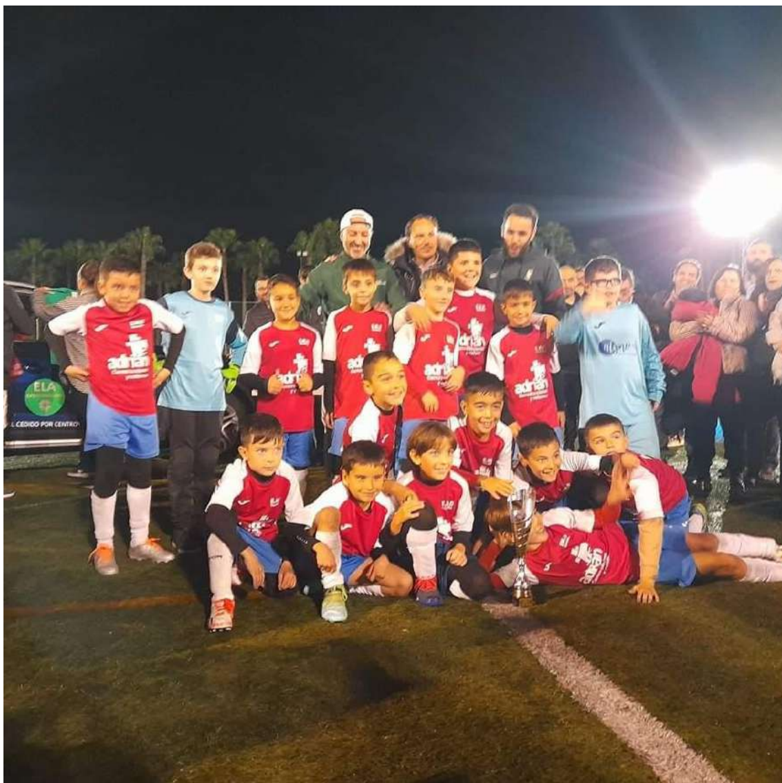
Equipo participante en el Torneo de Navidad de Talavera la Real

42 equipos y 600 niños de las categorías de alevín, benjamín, prebenjamín y zagalín participaron en el Torneo de Navidad organizado por U.D. Montijo con la celebración de más de 60 partidos en una gran jornada de ilusión vivida por los participantes, padres y entrenadores. El torneo empezó a las 9 y terminó sobre las 19 horas. Damos las gracias a Emilio Blanco y al Club por contar con nosotros, Ela Extremadura Asociación.