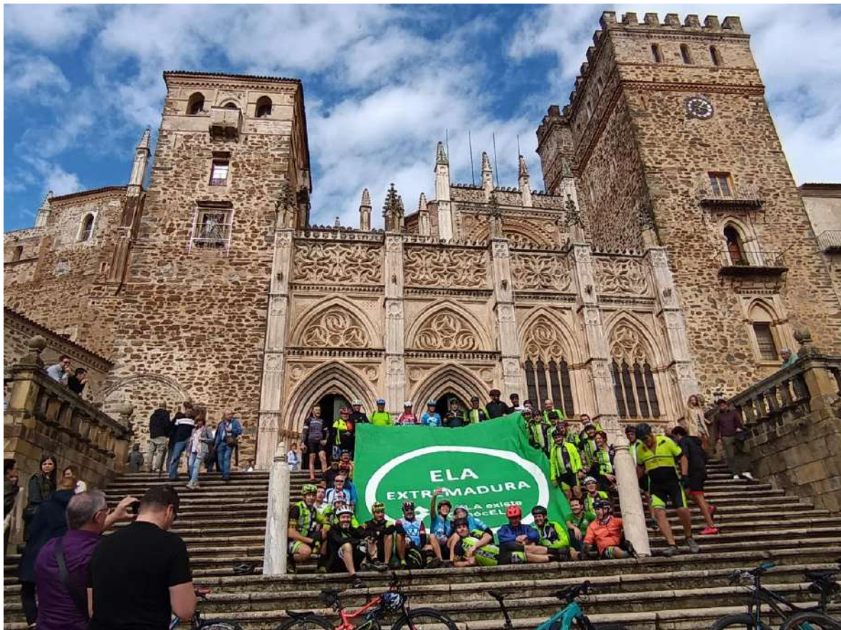
Llegada a La Puebla de Guadalupe a mediodía