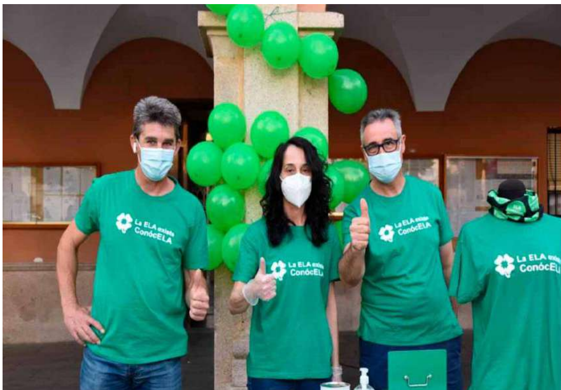
Voluntarios de la Asociación Ela Extremadura de Montijo

El Excmo. Ayuntamiento de Montijo concedió un galardón a la Asociación Ela de Extremadura el día de Extremadura por su capacidad de lucha y colaboración para dar a conocer la enfermedad en Montijo y ayudar a las personas que la sufren.