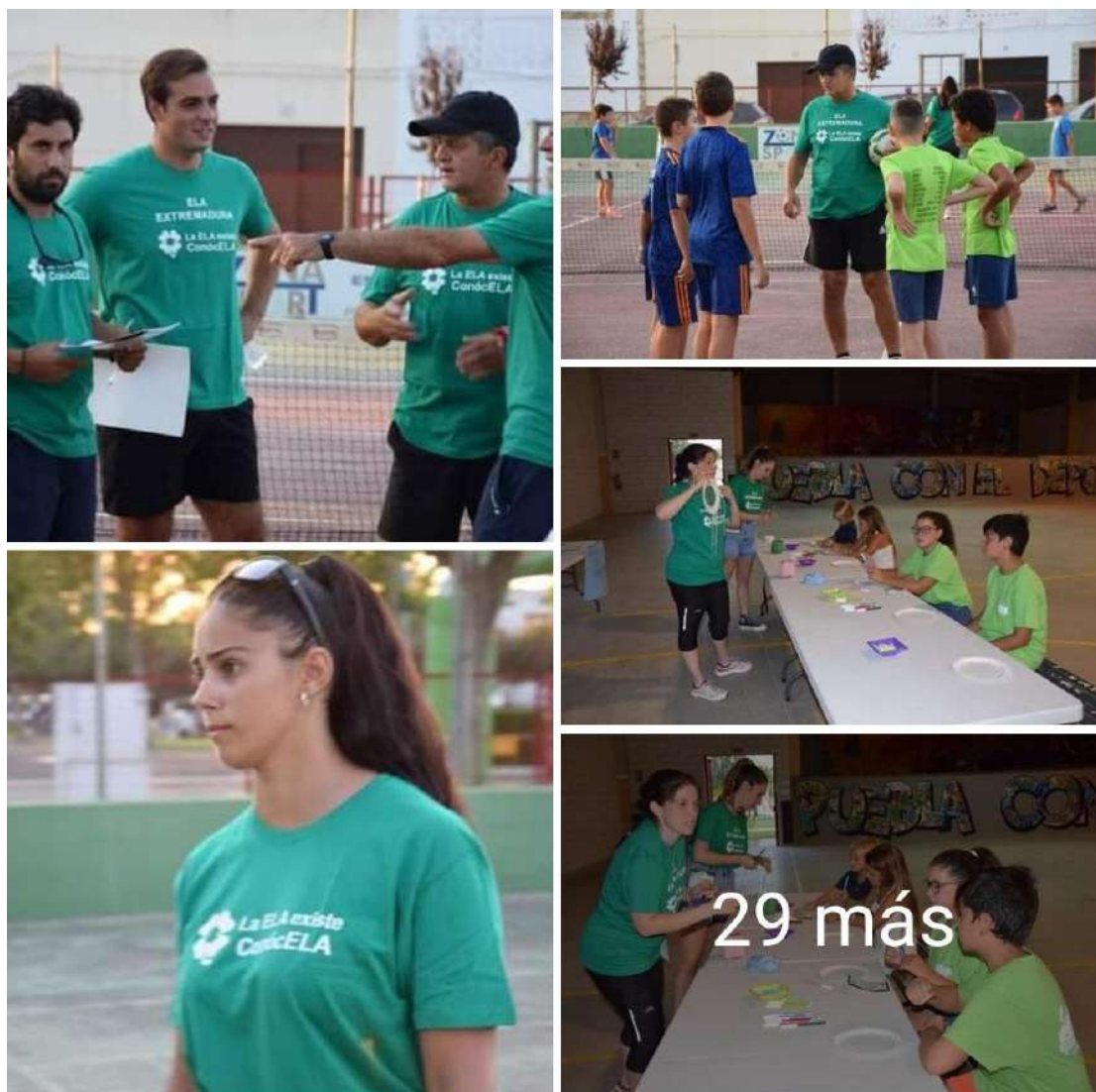
Noche Blanca Deportiva Solidaria en Puebla de la Calzada

La recaudación obtenida en esta edición de la Noche Blanca Deportiva solidaria del ayuntamiento de Puebla de la Calzada se destinó íntegramente a nuestra asociación.