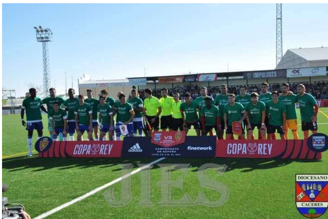
DIOCESANO 1 REAL ZARAGOZA 0

17 de noviembre de 2022. Cáceres. PREMIOS SOLIDARIOS 2022 GRUPO SOCIAL ONCE EXTREMADURA. ELa Extremadura es galardonada en los Premios Solidarios 2022 del Grupo Social ONCE Extremadura en la categoría de Institución, Organización, Entidad ONG por el magnífico trabajo de visibilidad de la ELA, fomento de la investigación y mejora de la calidad de vida de los afectados