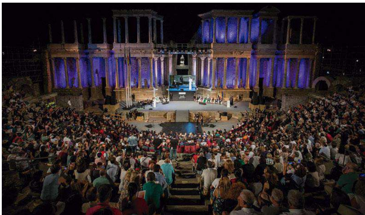
ACTO DE ENTREGA DE LAS MEDALLAS DE EXTREMADURA 2022