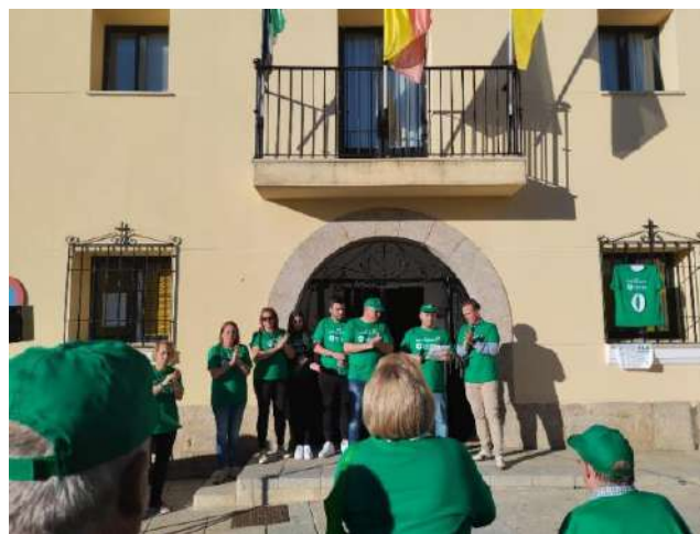
La Marcha solidaria de Majadas del Tiétar. 5 de noviembre de 2022